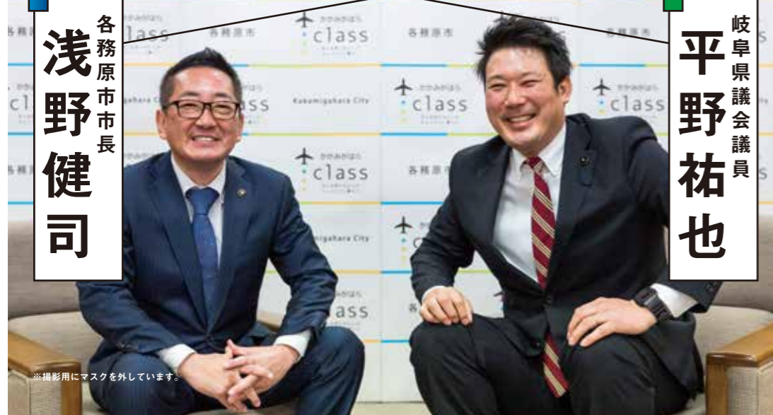
※撮影用にマスクを外しています。