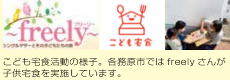
こども宅食活動の様子。各務原市では freely さんが子供宅食を実施しています。