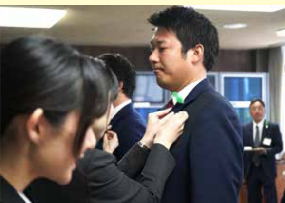
初登庁での議員証章交付式にて、緊張の面持ち。