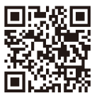
厚生労働省検討状況