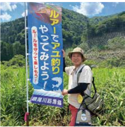
※根尾川の鮎ルアー解禁区にて

皆さん、最近魚釣りをしましたか？小さい頃に池や川で気軽に出来たことが、「危険」や「河川改修」等で自然豊かな岐阜県にいても河川が遠ざかっている様に感じています。岐阜県は全国有数の溪流釣りや鮎の友釣りの聖地であり、在来種がたくさん残っている貴重なエリアでもあります。しかし一番怖いのが「無関心」です。岐阜に住んでいても鮎の友釣りはハードルが高く、やったことがある同世代に会うことはほぼありません。川に親しみ、川を守り、川をオモシロイ場所にアップグレードしていくその第一弾が「鮎ルアー釣り」の解禁となります。