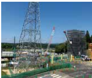
※中津川市建設現場の様子

アニメやマンガ等、各務原の博物館よりも展示が世相や生活に近い印象で大変参考になりました。今後連携して宇宙展や展示物の貸し出し等の合意も得ることが出来たので、岐阜かかみがはら航空宇宙博物館の魅力向上のためにこれからも頑張ります。