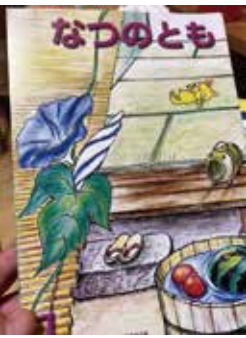
※小学一年生の「なつのもも」

改めて子供が元気に遊べる環境を意識的に作っていくことが大事だと思います。ちなみに、今も変わらなくて安心したのが子供の夏休みの敵？！である「夏の友」ですが、これって岐阜県オリジナルだぞ存知ですか？！岐阜県校長会の編集委員の先生方が愛情込めて作って頂いています。是非とも皆さんの周りの他県の出身の方に聞いてみてください！