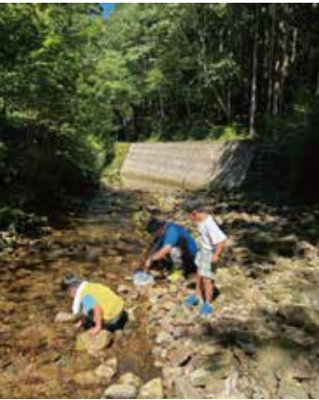
※息子と川遊びの一幕