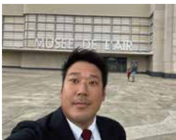
※フランスにあるルブルジェ航空宇宙博物館