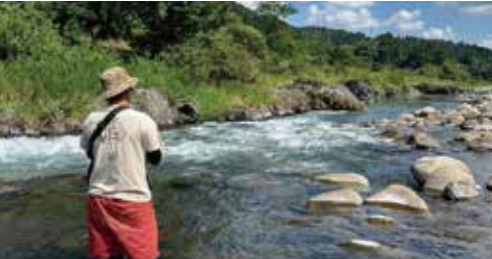
※いかにも鮎がいそうですが、この日は釣れませんでした。

兄弟と虫捕りや魚捕り、近所の公園でサッカーしたり野球したり、学校のプールが開放されていた様な気がします。今思えば平成の時代に育ちましたが、「昭和感」満載の過ごし方をしていました。近年は酷暑で、昼間に遊んでいる子供はあまり見かけませんし、コロナ明けで遊び方も変わっているのかもしれない。