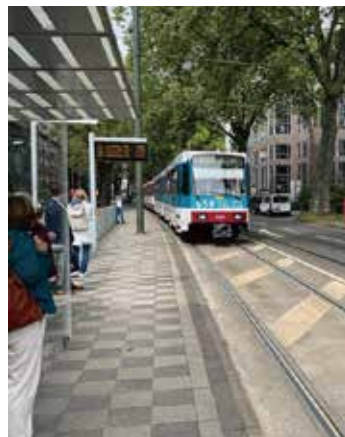
※ドイツの路面電車その①

LRT（次世代型路面電車システム）とは、「Light Rail Transit（ライト・レール・トランジット）」の略称で、各種交通との連携や低床式車両（LRV）の活用、軌道・停留場の改良による乗降の容易性などの面で優れた特徴がある次世代の交通システムのことです。2023年8月に開業し、交通渋滞の解消、免許返納による移動手段の確保、郊外への人口誘導や、駅周辺地価の上昇も含めて好調な滑り出しをしています。