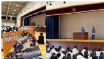
※各務原西高校での説明会の様子

岐阜県八百津町がモデルとなった「ハヤブサ消防団」ですが、消防団は日本各地、もちろん各務原市にもあります！消防団は災害の多い日本にとって非常に重要です。なぜならば既存の消防署は初期消防を担当することになり、例えば避難誘導や生存者の捜索等は消防団の仕事となります。しかし、団員数は減少傾向であり、30歳未満の割合が減少し、高齢化が進行しています。そうした中、そもそも消防署と消防団の違いを知らない方もたくさんいると思います。1期目の県議会において「県内高校生向けに必ず一度は消防団について説明するべき」と提言を行いました。その結果、県内公立高校で消防団説明会を行うことが決定し、昨年度は県内6校、今年には各務原西高校で開催することになりました！全校生徒向けに消防団の活動内容や役割を説明する貴重な機会となりました。岐阜県の生徒は消防団の役割を理解している状況になれば、団員数の減少も歯止めがかかるかと期待しています！是非ともご興味のある方は地元の消防団を覗いてみてください！