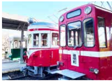
※旧名鉄美濃駅の展示車輛

僕が高校に入学したタイミングではあったものが卒業のタイミングで無くなったものが岐阜市にあります。それが「路面電車」です。僕の高校は岐阜駅から離れていて、最寄り駅である「忠節駅」という路面電車を利用して同級生もたくさんいました。それがある日突然無くなった時の衝撃はかなり