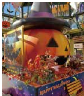
※河川環境楽園に設置されたモニュメント

県営公園でもある河川環境楽園の水遊び広場の横に、保護者の休憩所や更衣室やトイレ、多目的スペースも備えた「ひだまりホール」と「そよかぜテラス」が完成しました！工事やコロナで水遊び広場が休止となっていました。今年9月に完成して更に使いやすくバージョンアップしました！