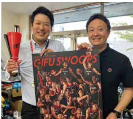
※岐阜バスケットボール株式会社事務所にて激励訪問！

いよいよ10月から開幕した国内バスケットボールリーグのBリーグ。岐阜県にはB3に所属する「岐阜SWOOPS（スウープス）」があります。開幕前の天皇杯ではB1を撃破するというジャイアントキリングを達成して、実力も経験も積んだ我が岐阜SWOOPS！バスケットW杯での盛り上がりで、初めてバスケットを観た方、久しぶりに観た方、いつも観てる方、Bリーグも面白いですよ！B3でも屈指の集客を誇るアリーナの盛り上がり是非体感しに来てください！GO！！SWOOPS！！