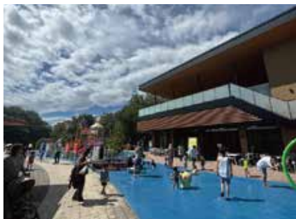
※新設された休憩所と多目的スペース

こちらの新しい休憩所は僕が初当選した時から、皆さんの声や自分が子供を連れて行った時に感じた、「保護者側の日陰がない」「更衣スペースがない」といった問題提起を行ってきた結果、今年実現出来ました！「岐阜県一番の子連れファミリーの味方」スポーツを指して更に楽しい施設にして行きたいと思えます！ご意見ありましたらお気軽にどうぞ！