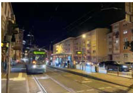
※ドイツの路面電車その③

機会となりました。各務原市も南北の交通網が弱いので、東西の路線網に南北は路面電車なんか面白い選択肢ではないかと感じています。こういったゼロから何かを踏み出す勇気が最近足りていなかったと思うので、柔軟に知見を広げて頑張りたいと思います！