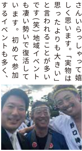
※蘇原加佐見神社例大祭

2017年に33歳で岐阜に戻ってきて、早いもので6年が経過しました。この春に無事に2期目の当選を経て岐阜県議会議員として日々活動しています。2期目と言っても1期目はほぼコロナ期間でしたので、いわゆる「政治家」というような活動は出来ておらず、2期目になって初めて直接お会い出来た方もたくさんいらっしゃって嬉しく思います。「実物は思ったよりも大きい」と言われることが多いです（笑）地域イベントも凄い勢いで復活しています。初めて参加するイベントも多く、