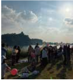
※鵜沼南町木曾川イベント

新しい気づきや「各務原市ってオモシロいなあ」と思うこともたくさんあります。伝統や文化は一朝一夕では築かれず、継承していくことの大事さと再開することの難しさの両面感じる日々です。一方でコロナ期間の方が自分の政策で突き詰めたいことや現地に見に行くといった時間が多かったように思います。中々バランスが難しいと実感する日々ですが、「世の中の仕組みを変えるのが政治家の仕事」というのは変わらないと思いますので、LINEやSNS等からお気軽にご意見やご連絡を頂ければと思います。