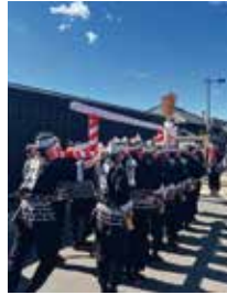
※鵜沼宿秋祭り 木遣