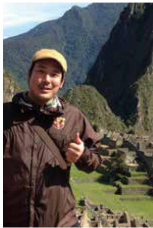
※2013年ペルーにて(当時29歳)