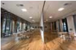
※低層棟 1F 市民交流スペース

未来を見据えてまちづくりを行う拠点として市民の皆さまに活用して頂ければと思います。過去の文化や伝統を引き継ぎながら、新しい未来や社会の変容に合わせて、僕自身、育てて貰った岐阜県や各務原市にしっかりと恩返しをしていきたいと改めて誓いたいと思います！