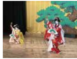
※村国座の子供歌舞伎

新しい気づきや「各務原市ってオモシロいなあ」と思うこともたくさんあります。伝統や文化は一朝一夕では築かれず、継承していくことの大事さと再開することの難しさの両面感じる日々です。一方でコロナ期間の方が自分の政策で突き詰めたいことや現地に見に行くといった時間が多かったように思います。中々バランスが難しいと実感する日々ですが、「世の中の仕組みを変えるのが政治家の仕事」というのは変わらないと思いますので、LINEやSNS等からお気軽にご意見やご連絡を頂ければと思います。