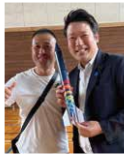
※PTA主催ロケット教室