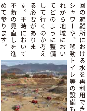
※消防団による大規模送水訓練

発生し、被害情報が中々出てこない状況でした。災害時には職員や関係者も被災者です。マニュアル通りに進まない前提に立ち、基礎自治体の初動の役割は情報収集をして県や国、自衛隊に適切な支援を求めることに徹して良いと感じます。東日本大震災の際にはドローンや人工衛星、最近では悪路走破性の高い四輪バギーといった技術は現在ほど安価に普及していませんでした。新たな技術を用いながら、マニュアル通りに動けないことを前提としつつ、民間や地域住民と連携して備えることが重要であると考えます。今回の避難所における水を再利用できるシャワーや、移動トイレ等の設備もこれから地域においてどのように整備して行くのか考える必要があります。平時において不断の見直しを進めて参ります。