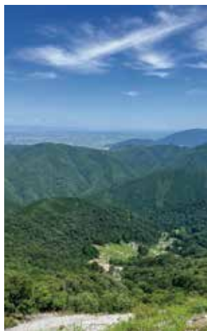
※伊吹山より揖斐郡を望む

皆さんの中で、「山林を持っている」という方もいらっしゃると思います。しかし、林業従事者の方はほとんどいませんし、家族の誰かが林業をやりたいという方もいないと思います。そもそも自分の山の境界線をご存知でしょうか。「先祖伝来の山だから売れない」「そもそも売り先もない」なんて言う声も聞こえてきそうです。地元の森林組合に知り合いなんかがいると、管理して伐採して貰っている方もいるかもしれませんが、伐採するまで何の収益もありません。現状の日本の林業問題を明記しただけと言う感じになっていきますが、「森林信託」と言う業界を変えるかもしれない取り組みがお隣の愛知県で始まるかもしれません。そもそも森林信託とは、森林の所有者が委託者となって信託銀行などに所有権を移転します。信託銀行は複数所有者から