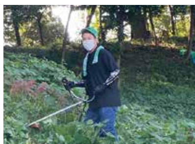
※坊の塚古墳の草刈りの様子

受託した森林をまとめ、別の事業者が管理を任せます。そこから生まれる収益を、信託銀行と所有者で分ける仕組みとなります。森林の所有者を集約し、より大きな面積を一括して事業者に委ねることで、作業効率が上がると利益率の向上が見込まれます。また、信託することで相続時の手続きもスムーズになるメリットもあります。全国では20年8月、岡山東栗倉村が初めて森林信託制度を導入しましたが、中々後に続く場所がありませんでした。こうした森林信託においては、将来の伐採時に利益を分配することによって、キャッシュフローの安定化を図ります。また「森林」が投資対象として運用商品化する可能性もあります。実際に米国においては3つのREIT（不動産投資信託商品）として森林信託が上場しており、平均利回りに近い3%以上で運用できる投資商品となっています。日本の場合は、境界が確定しておらず、相続で細分化されており、かつ山林に興味がないと言う方が多いと思いますが、