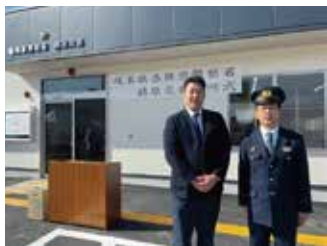
※各務原警察署長と開所式にて

蘇原吉野町に新築移転された蘇原交番の開所式に参加しました。新蘇原交番は、尾崎駐在所と旧蘇原交番を統合した新体制となります。近年、岐阜県内で交番や駐在所の再編が進んでいます。人口減少下で警察官も増やせない中で、事件や事故件数は減つても新たな相談が増え、24時間体制を維持する人練りも大変な現状です。地元自治会長さんからの、「今回の再編によって交番が近くなった地域もあれば遠くなった地域もあるので、引き続きのパトロールをお願いしたい」という言葉が印象的です。新しい交番は、交番襲撃事件を受けた新たな設備増強、女性警官が増える中で仮眠室やシャワーを分けること等、時代に合わせた形となっています。尚、今回の新設により蘇原交番に初めて女性警官が着任したそうです。地域密着で安心安全を守る警察官と一緒に各務原市を盛り上げて行きたいと思ひます!