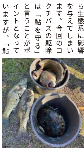
※駆除されたコクチバスを含む外来種たち

今回の議会において提案した、災害発生時にデジタル技術や新技術を用いての「リアルタイム情報収集体制の構築」について、当初予算において大幅に盛り込んで頂きました。今回の能登地震は、元旦という非常に難しいタイミングで発生しました。災害時の人命救助においては「72時間の壁」という言葉があり、それを過ぎると生存率が大幅に下がります。今回の能登地震においては孤立集落が多く