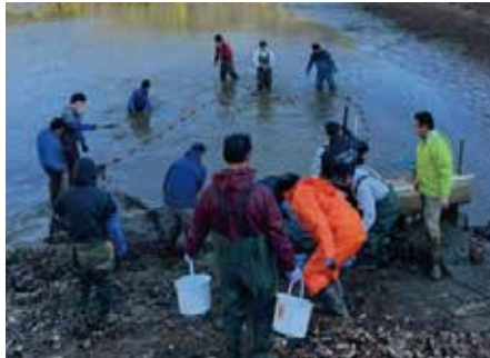
※県・市・漁協関係者による駆除作業の様子

ら生態系に影響を与えてしまいます。今回のコクチバスの駆除は「鮎を守る」と言うことがポイントとなっていますが、「鮎を守る」と言いながら単純に釣り人の為に行っているという側面も強く浮き出ていると思います。その一方、長良川でニジマスの釣り堀を開催することは大きく矛盾しています。「生態系を守る」と言うことは非常に地味で、無くなつてからしか気付かないという世界なので、利害関係者がいる「鮎を守る」と言う発想になつてしまいがちです。「岐阜県の自然や日本の生態系を守る」と言う本質的な目的を忘れずに取り組みを推進していきたいと思ひます。