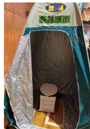
※地域防災訓練で設置したトイレ

蘇原吉野町に新築移転された蘇原交番の開所式に参加しました。新蘇原交番は、尾崎駐在所と旧蘇原交番を統合した新体制となります。近年、岐阜県内で交番や駐在所の再編が進んでいます。人口減少下で警察官も増やせない中で、事件や事故件数は減つても新たな相談が増え、24時間体制を維持する人練りも大変な現状です。地元自治会長さんからの、「今回の再編によって交番が近くなった地域もあれば遠くなった地域もあるので、引き続きのパトロールをお願いしたい」という言葉が印象的です。新しい交番は、交番襲撃事件を受けた新たな設備増強、女性警官が増える中で仮眠室やシャワーを分けること等、時代に合わせた形となっています。尚、今回の新設により蘇原交番に初めて女性警官が着任したそうです。地域密着で安心安全を守る警察官と一緒に各務原市を盛り上げて行きたいと思ひます!