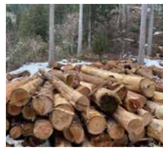
※本巢市の林業の現場にて

今後温室効果ガス削減や環境意識の高まりにより、宝の山に変わる可能性もあると思います。日本の林業は税金が多く投入されていますが、民間からお金が集まるような仕組みが作れたら良いなと考えています。岐阜県としても森林信託の広がりにしっかりと付いて行くように研究を進めて行きたいと思っています。