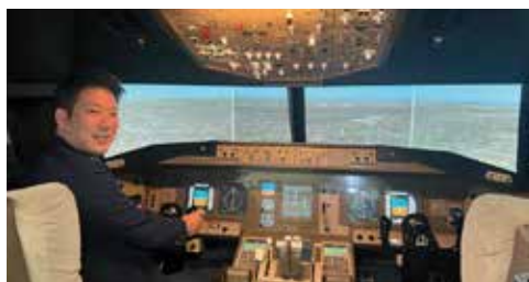
※フライトシミュレーターに挑戦してみました。

岐阜県関市にある航空業界就職への専門知識が学べる「中日本航空専門学校」を訪ねました。