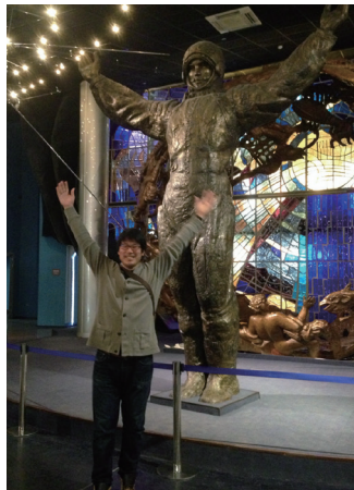
ロシアのモスクワにある宇宙飛行士記念博物館のガガーリン像前にて(2014年11月)