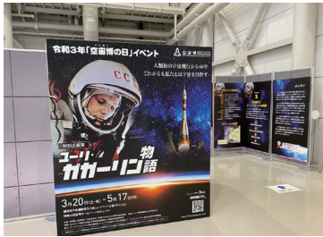
岐阜かかみがはら航空宇宙博物館特別企画展

世界的に見ると、この「宇宙」の分野は民間企業がこぞって参入する業界となりました。宇宙ビジネスの規模は2010年には27兆円規模だったのが、2019年には40兆円、2040年台には100兆円規模になると言われています。内訳を見ると「ロケット・人工衛星」が6%弱、「衛生データ・衛生テレビ」等の宇宙利用が3.5%を占めます。日本の市場規模はまだ1兆円に届きません。各務原市を代表する企業である川崎重工さんもロケットや人工衛生の製造に携わって