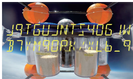
shuttleD プロジェクトにて成層圏で検体実験を行う様子

等、大人から子供まで巻き込んだ宇宙ビジネスを展開中。様々な企業とのコラボも行っているの、ご興味がある方は是非ともお問い合わせください！