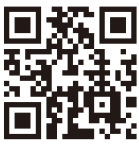
内閣官房国民保護ポータルサイト

「国民保護」は、みなさん一人ひとりの命や財産に直接関係するとても大事なことです。政治家としては「常に最悪に備えて準備する」ということが大事だと思っています。こうした法整備があることは間違いないのですが、まずは内容を見てみてください。漠然としており、国民からすると具体的にどの様に行動したら良いかの答えがある訳では有りません。今回のウクライナ侵攻を受けて、改めて「国防」について「真面目に」、「冷静に」、考えないといけないタイミングだと思います。航空自衛隊岐阜基地の隊員の皆さんには、日夜、日本の平和維持の為に空を守って頂いていることに改めて敬意と感謝を表します。いざ自分の事と考えると目を背けたい気持ちは僕も同じですが、国民のほとんどが意識していかないと思いたすので、問題提起も兼ねて取り上げました。ロシアのウクライナへの侵略行為は決して許されるものではありませんし非難すべきこと