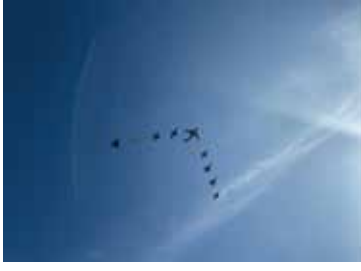
※航空自衛隊岐阜基地における航空祭の写真

インナも想像出来なかつたことだと思えます。しかし、天災同様、必要な備えは、平和なときにこそ真面目に考えておくべきではないかと考えられます。