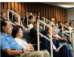
熱心な多くの支援者が耳を傾ける

回答 航空産業、県内産業にとって 経営統合により研究開発拠点の充実 を期待。大学の枠を超えて人材育成 や研究開発に取り組む。新たな地域 起業家支援の充実に努めていきたい。